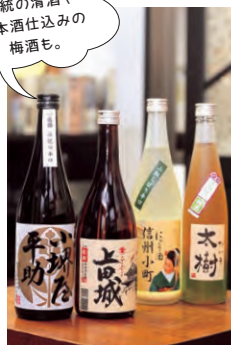
伝統の清酒や日本酒仕込みの梅酒も。