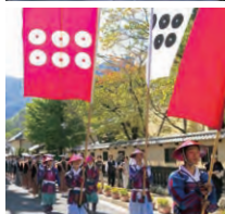
写真左/松代城跡 写真右上/真田邸(新御殿) 写真右下/真田十万石まつり