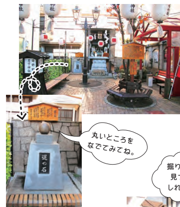
丸いところをなでてみてね。

海野町の商いの守護神として造営されたのが「高市神社」。社殿の隣には「運の石」があり石をなでると悪運を払い良運を授けられると云われています。