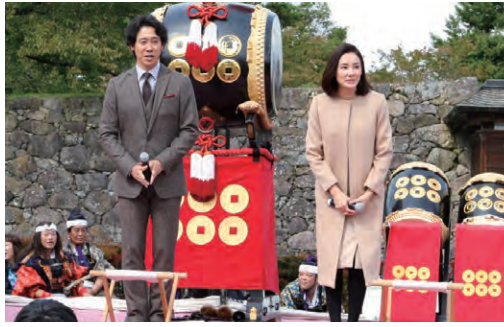
撮影「松代藩 真田十萬石まつり」にて(10月11日)