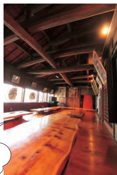
立派な梁や柱がある日本家屋。

独自に開発した発芽そばが自慢のそば店。店主も柳町再生の立役者のひとり「東京からこへ来たときはベニヤだらけでゴーストタウンのようだった。でも元の形はとても美しかったんです」と当時の様子を語ってくれます。