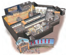
※この図はイメージです

2016年1月17日、上田城跡公園内(旧市民会館)にオープン。真田信繁(幸村)の生涯を描くドラマのストーリーに沿って、衣装やセットなどを展示し、大河ドラマの世界が体感できる新スポットです。