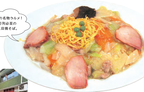
上田の名物グルメ! 行列必至の五目焼そば。