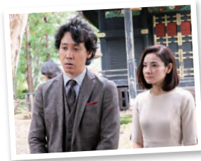
撮影「真田丸」にて(10月11日)