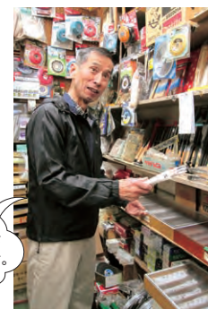
ウチの彫刻刀は自慢の品揃えだよ。

元気なご夫婦が営む、昭和23年創業の老舗金物店は、困ったときに助けてくれる街の寄り处的な存在です。ご主人の人柄からもこの商店街の良さが実感できます。