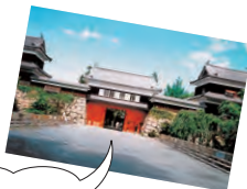
上田城は「お城ファンが好きな城」としても有名な名城です。

新年からはじまる大河ドラマ「真田丸」の舞台となる信州・上田。真田昌幸によって築かれたとされる名城 上田城とともに、戦国の世から歴史を紡ぐ城下町には、歴史ロマンや地元で愛され続ける味、若者が創り出す新しい文化など、さまざまな魅力がいっぱい。上田城を訪れるなら一緒にぶらりと歩いてほしい、2つの町をご紹介します。