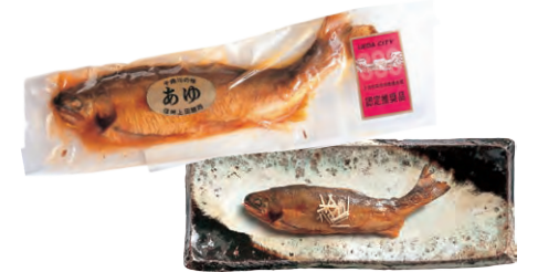
あゆ甘露煮 486円 鯉西

千曲川の伏流水で養殖されたあゆを使った名物の甘露煮。焼いてから1日干したものを約8時間かけてじっくり煮込んであるので骨まで柔らかく子どもからお年寄りまで楽しめます。1匹ずつの真空パックも便利。