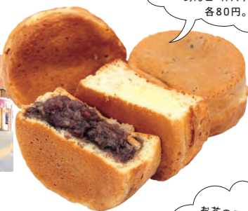
これが志まんなやき! あんこ・カスタード各80円。

9:30の開店とともに絶えず人が訪れるのが富士アイス。目当ての品は「志まんなやき」と呼ばれる大判焼き。たっぷり自家製あんこが入り、次々と焼かれる様子も名物のひとつ。上田さんぽの必須おやつです。