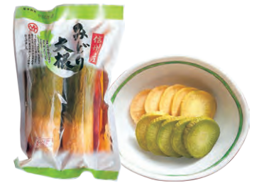
みどり大根 300円 竹内農産

信州上田地域の名産品の青大根をまるごと糖絞りにして、芳醇な香りと旨みが楽しめるたまり醤油漬に。寒暖の差が育てた大根はたっぷりの甘みとほど良い辛味を持ち、パリッパリとした食感も特徴です。