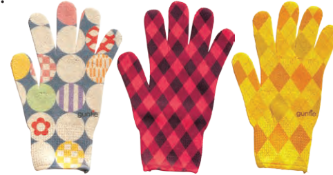
軍手イ 一双500円 ハナサカ軍手イプロジェクト

柔らかな生地にカラフルなデザインを施した新感覚の軍手。2015年度は和柄や定番柄を含めた全14種類を販売。「感謝」「新しい」など毎年コンセプトを立て、より新鮮なデザインになるよう工夫もしています。