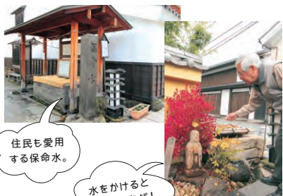
住民も愛用する保命水。

町の一角には海禅寺の境内に湧く水を引いた「保命水」があります。また柳町入口には水を掛けて祈るとご利益があるという「水掛け地蔵」や水滴の反響音が楽しめる「水琴窟」など水の名所が多いのも柳町の魅力です。