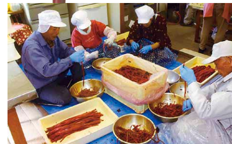
最も大変な作業が皮むき。機械などでは上手くむけず、すべて手作業。スジを残すと噛み切れなくなってしまうそう。