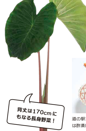
背丈は170cmにもなる長身野菜！