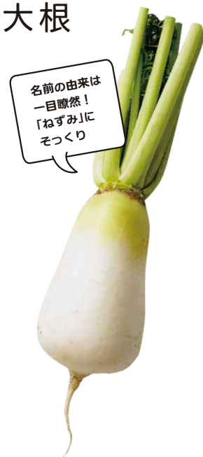
名前の由来は一目瞭然！「ねずみ」にそっくり