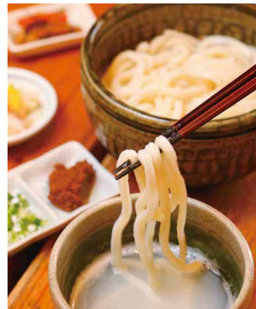
味ロジック びんぐし亭のおしほりうどん(760円)。土日はおしほりうどんも食べ放題のバイキングを開催。さらに11~2月の旬の時期には「ねずみ大根のかき揚げ」も登場します。