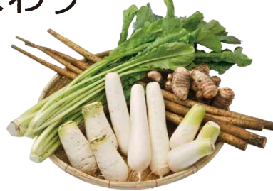
秋から冬にかけて、旬を迎える信州の伝統野菜たち。

固有の風土の中で育まれる伝統野菜。普通の野菜とは異なる味・香り・カタチは、古くから地域の食文化に根付き、今も脈々と受け継がれています。この地域の宝を守り、そして多くの人に知ってもらうため、長野県では、平成19年に「信州伝統野菜認定制度」を創設し、現在75品種がその選定を受けています。これからは、根菜がおいしくなる季節。地域の人々の愛情が詰まった、信州の滋味をお楽しみください。