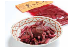
道の駅などで販売される「あかたつ漬」は酢漬けと塩漬けの2種類で各540円。