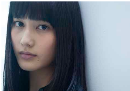
女優 橋本 愛さん

映画「バースデーカード」は8割以上を諏訪地方で撮影させていただきました。ロケのメインの場所は、諏訪湖を見渡す高台にあって、すごく気持ちが良かったです。そして諏訪といえば花火。劇中にも花火のシーンがありますが、夏は花火大会の日じゃなくても毎晩花火が上がるんですよ。 あと、うなぎは、めちゃくちゃおいしかったです！表面はパリッ、中はふんわり。諏訪は関東と関西の真ん中にあるので、両方のいいとこどりの作り方をしているんですって。この味は、ぜひ皆さんに知ってほしいですね。 美しい空の下、辛くても前向きな気持ちで紀子が坂を駆け上がる場面は、諏訪だからこそ撮ることのできたとても素敵な映像になっています。豊かな自然と澄んだ空気、ゆったりとした時間が流れる中、愛情あふれるバースデーカードを通じて少女が大人へと成長していく姿を見てもらえたら嬉しいです。