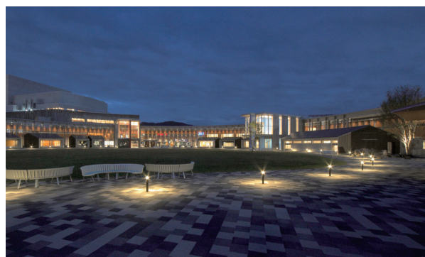
サントミューゼ(夜景)