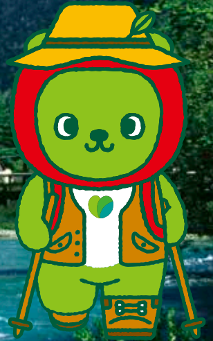
長野県PRキャラクター「アルクマ」(信州DC) ©長野県 アルクマ