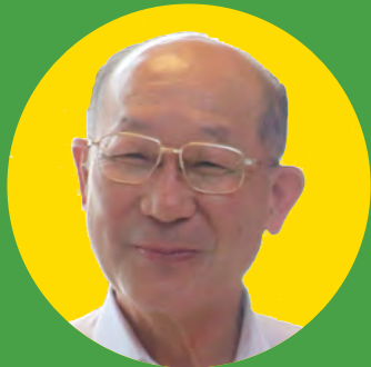
やさしい貴舟村長 ※当日は来場しません